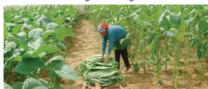
Besuche der Tabakfelder und Manufakturen