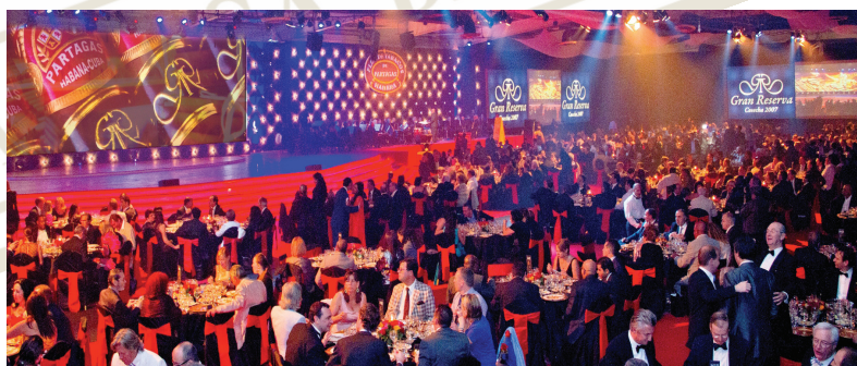
Höhepunkt des Festivals: das Galadinner mit den Auktion besonderer Humidore. Ihre Auktionsangebote liegen dabei selten unter einem sechsstelligen Betrag.