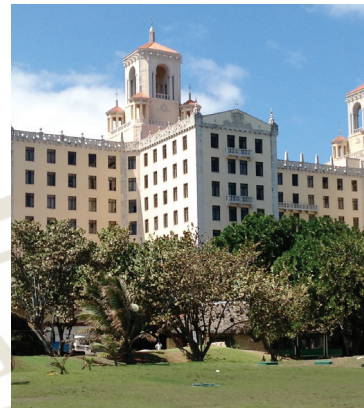
Pflege der Geselligkeit unter Zigarrenfreunden: Hierzu eignet sich wunderbar die Terrasse des Hotels „Nacional“.